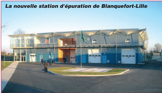
La nouvelle station d'épuration de Blanquefort-Lille

L'Agence vient de dresser le bilan de l'assainissement des collectivités du Bassin Adour-Garonne : si certaines agglomérations enregistrent encore du retard par rapport aux exigences européennes, la majorité d'entre elles a consenti