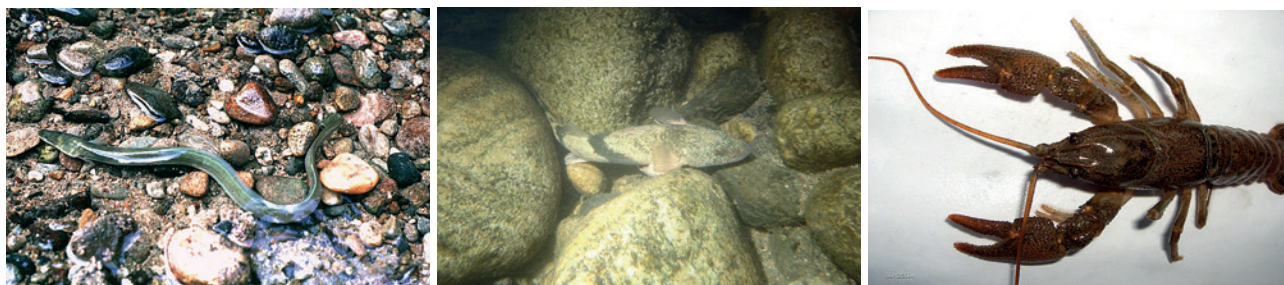
Figure 3 : Exemples d'espèces aquatiques en danger critique : l'anguille européenne, l'apron du Rhône et l'écrevisse des torrents.